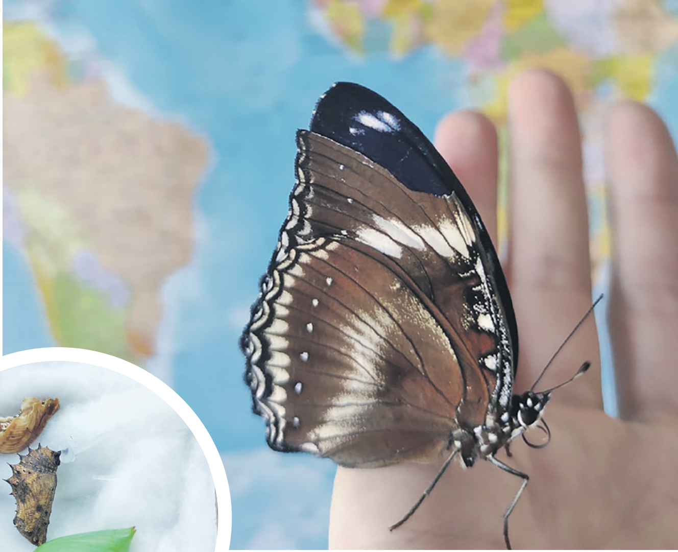
Тропические красавицы прекрасно себя чувствуют в домашних условиях

А РОВНО ЧЕРЕЗ ДВА ДНЯ УТРОМ МЫ ОБНАРУЖИЛИ НА СЕТКЕ ЧУДЕСНУЮ ЛУННУЮ БОЛИНУ. И ЭТО БЫЛ ВОСТОРГ!