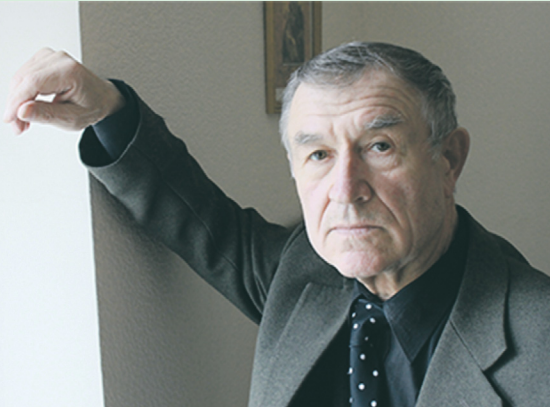
ПЕВЕЦ РОДНОГО КРАЯ